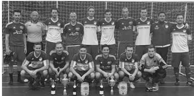
Turniersieger SG Reutlingen I & Zweitplatzierter TSV Genkingen I

Wir bedanken uns herzlich bei allen angereisten Mannschaften, Helfern und Sponsoren, die wieder maßgeblich zum Erfolg des ganzen Tages beigetragen haben.